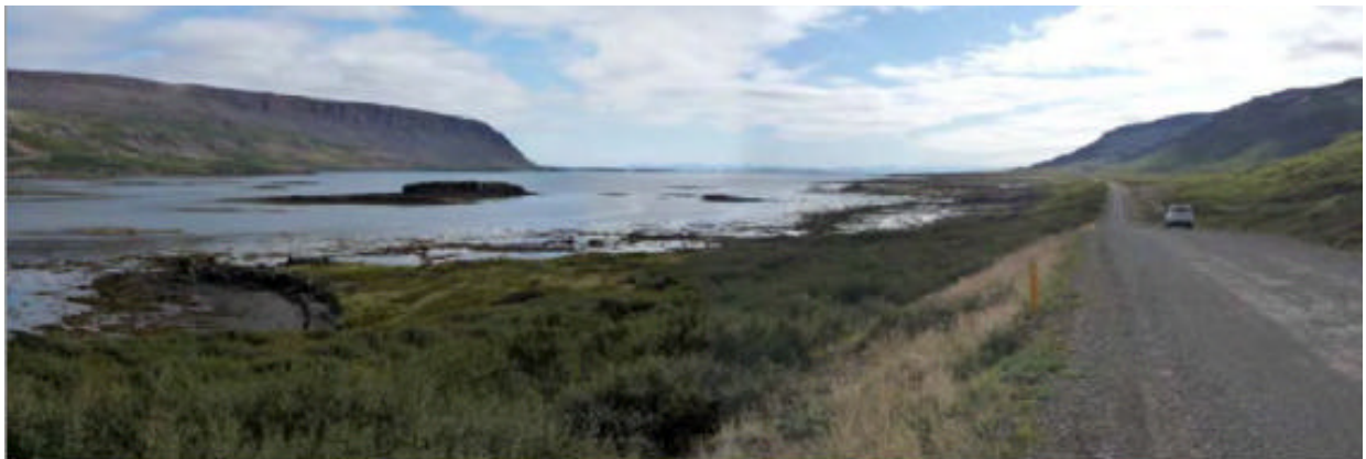
Mynd 9-2. Horft út Kjálkafjörð yfir fyrirhugaðan þverunarstað.